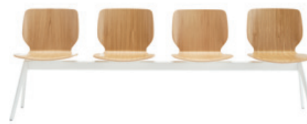
— Bench 2-5 seater Banco 2-5 plazas