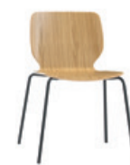
— 4 leg 4 patas