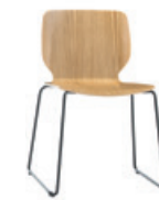
— Sled base Pie de varilla